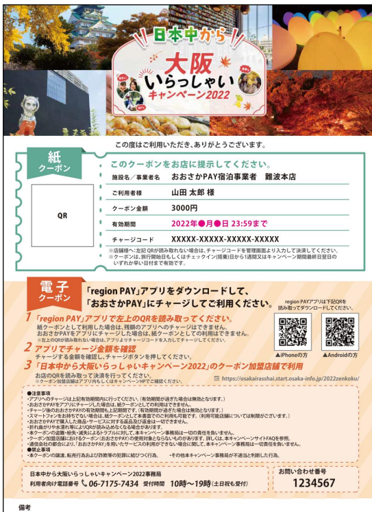
(1枚目：おおさかPAYクーポン)

※販売元が提供するポイントサービスや、株主優待券などの各種割引を利用する場合、それらの「割引適用後の宿泊（利用）代金」を入力し、発行してください。